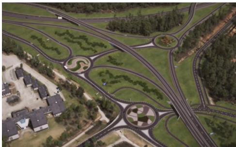
Ritning över den nya trafikplatsen.

Så har då högsta instans, Regeringen, bestämt att det är ok att bygga en mastodontisk storskalig trafikplats vid Fagrabäck. Vad är det som gör att politikerna i Växjö kommun inte har insett att om vi fortsätter på den inslagna vägen kommer snart jordens resurser att vara uttömda. Då kommer våra glaciärer att smälta ner med översvämning av stora delar av vårt klot som ett resultat.